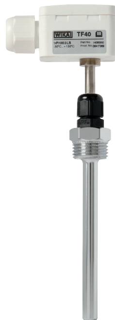
Модель TF40 с защитной гильзой